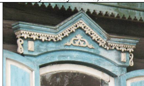
ул. Ярославского, 35