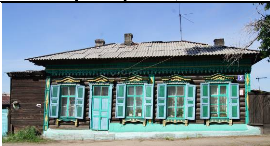
ул. Декабристов, 5