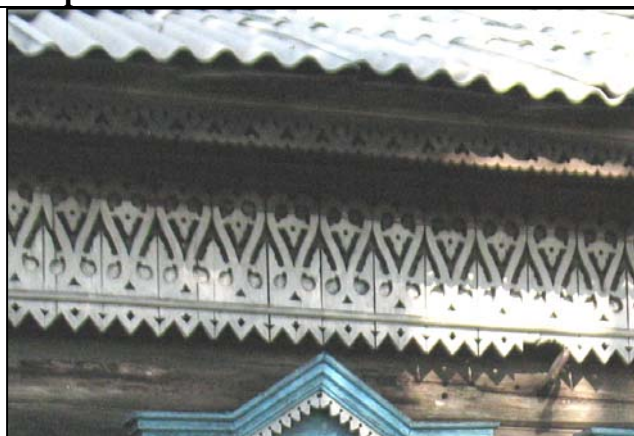
ул. Широкая, 28