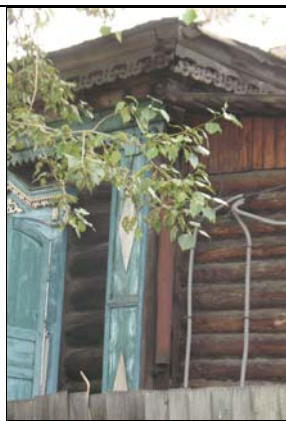
ул. Ярославского, 35