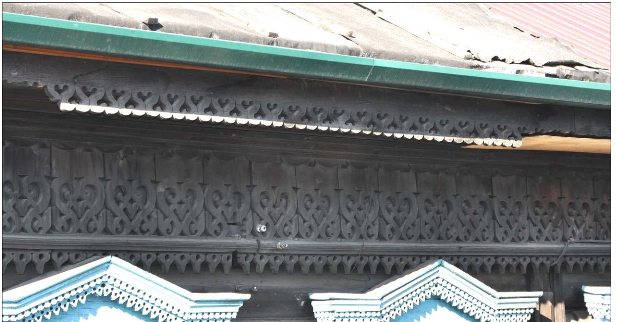
Резные полосы фриза и карниза