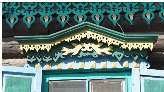
ул. Декабристов, 5