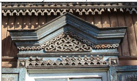
ул. Анохина, 42