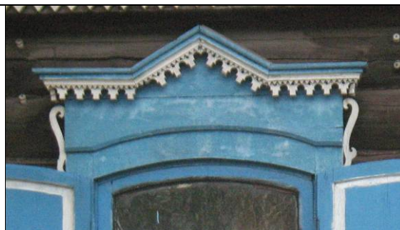
ул. Ярославского, 27