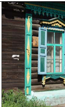
ул. Декабристов, 5