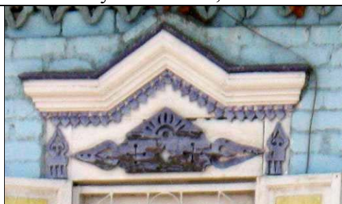
ул. Засопочная, 79