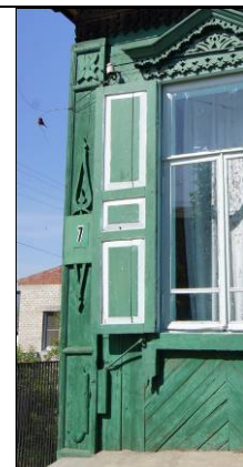
ул. Декабристов, 7