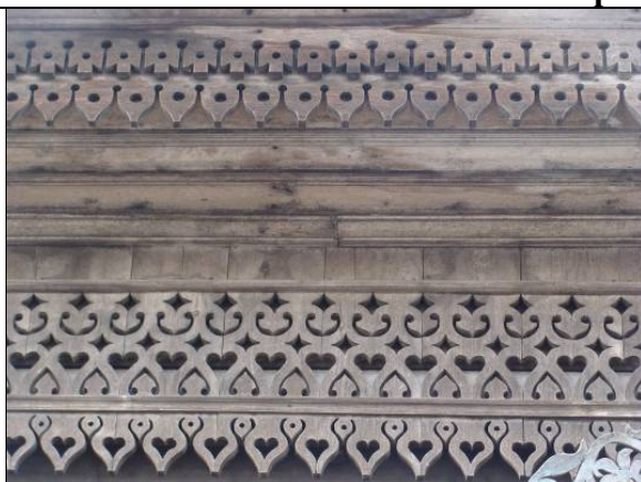
ул. Анохина, 31