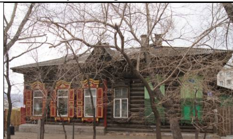
ул. Декабристов, 17