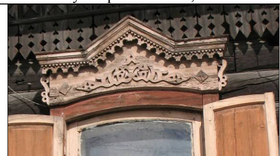
ул. Бабушкина, 56