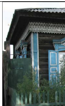
ул. Широкая, 28