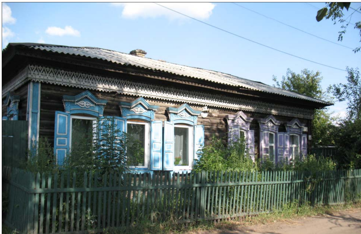
«Дом жилой», г. Чита, ул. Ярославского, 27