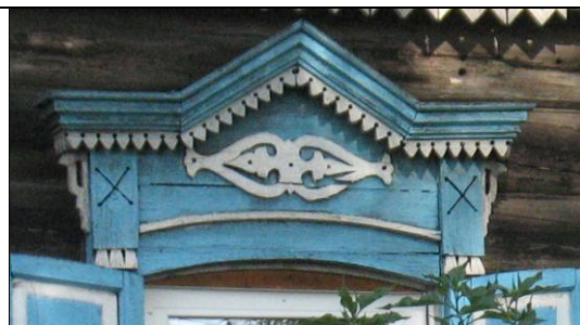
ул. Широкая, 28