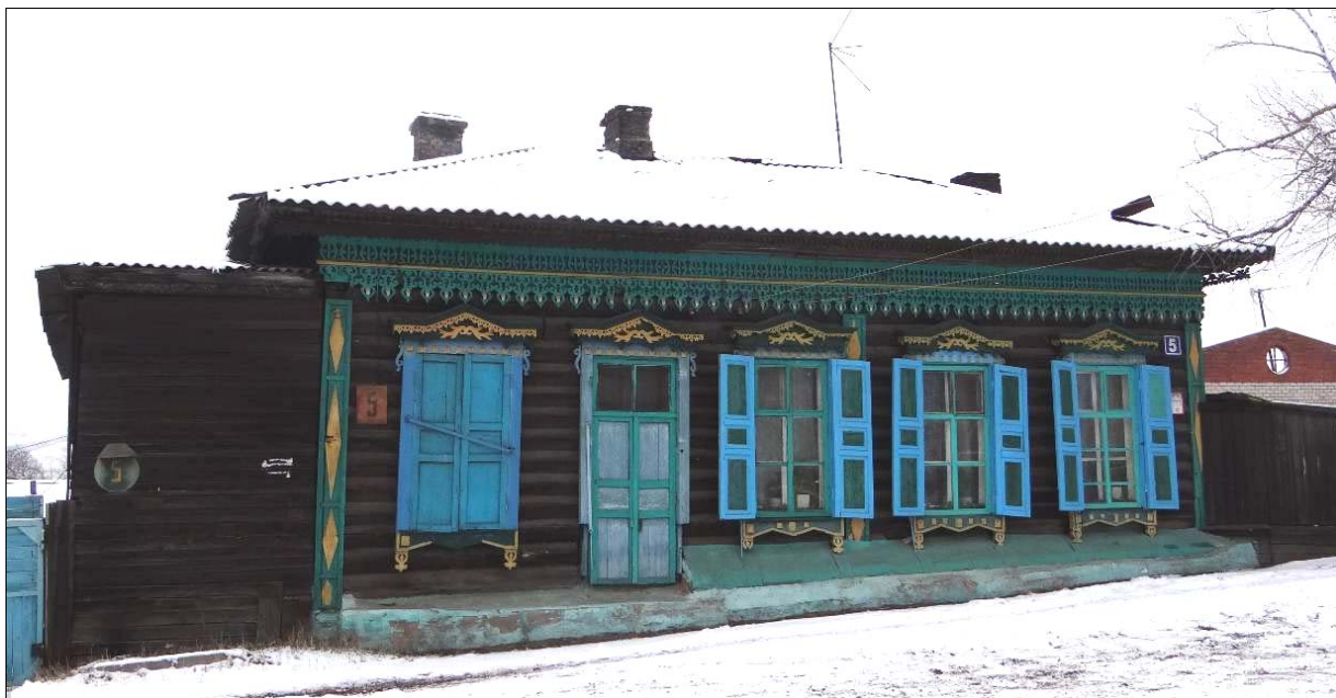
«Дом жилой Я.Эдуардова», ул. Декабристов, 17