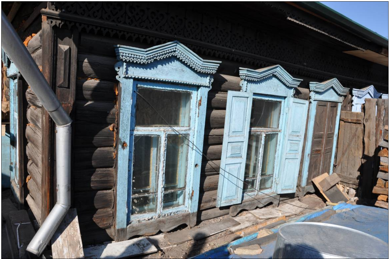
Фрагмент главного фасада