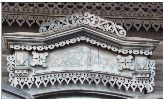
ул. Анохина, 31