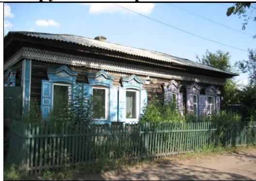
ул. Широкая, 28