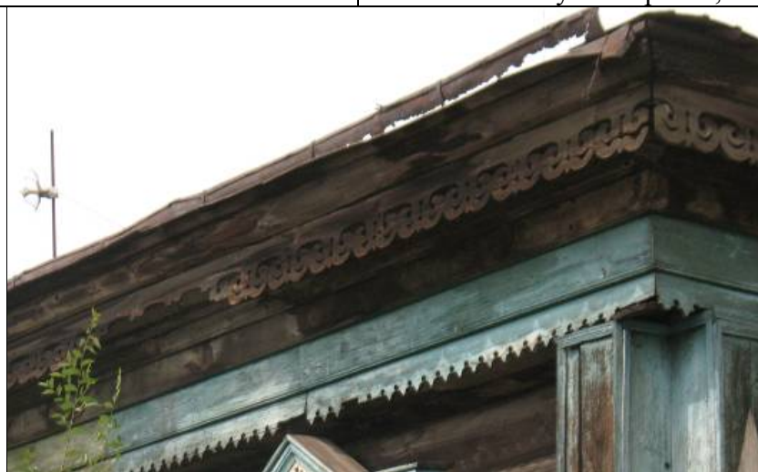
ул. Ярославского, 35