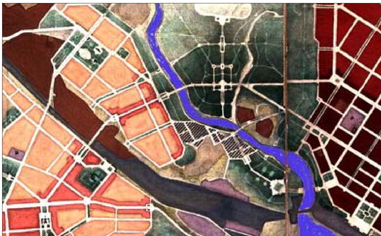
Фрагмент проекта планировки и застройки 1963 года.